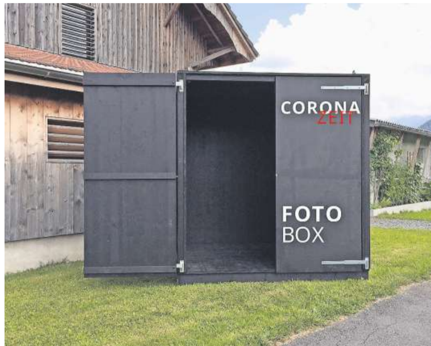
FotosSZ nimmt bis Weihnachten Corona-Zeit-Fotos aus der breiten Bevölkerung entgegen und stellt sie in der Fotobox in Steinen aus.

Die vielen in der Corona-Zeit entstandenen Fotos, welche auf Wanderungen und Spaziergängen geknipst wurden, können auf diesem Weg mit der Bevölkerung geteilt werden. Dabei müsse man auch kein Profifotograf sein. Der Fokus liege bei FotosSZ 21 auf